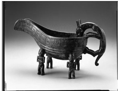
西周晚期人足獸鬃匜

這件人足獸鬃匜的把手是一隻形體碩大的巨耳龍，以四隻足攀附匜器，伸長脖子，探頭入匜的造型。然而匜的四足卻皆是四位兩隻手互相交握，兩耳穿孔，裸露上身的男性，四個人皆頭頂戴帽表情木然地以頭顱來支撐著匜器。西周是個封建社